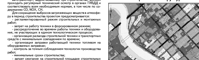
Схема использования территории